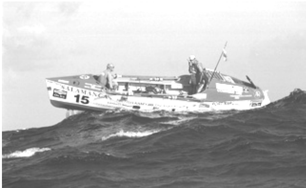
Et engelsk hold fra Atlantic Rowing Race 2001.

Det er kommet nogen for øre at et tidligere medlem af ASR og undertegnet har tilmeldt os til verdens længste kaproning Atlantic Rowing Race , den er god nok.